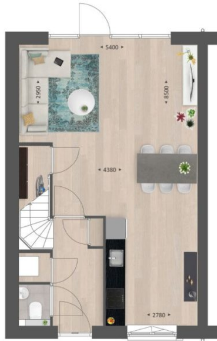
GETEKEND TYPE A2 (BOUWNR. 27, 32, 37)