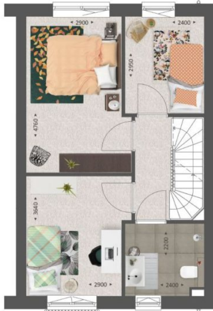
GETEKEND TYPE A3 (BOUWNR. 31, 36, 41)