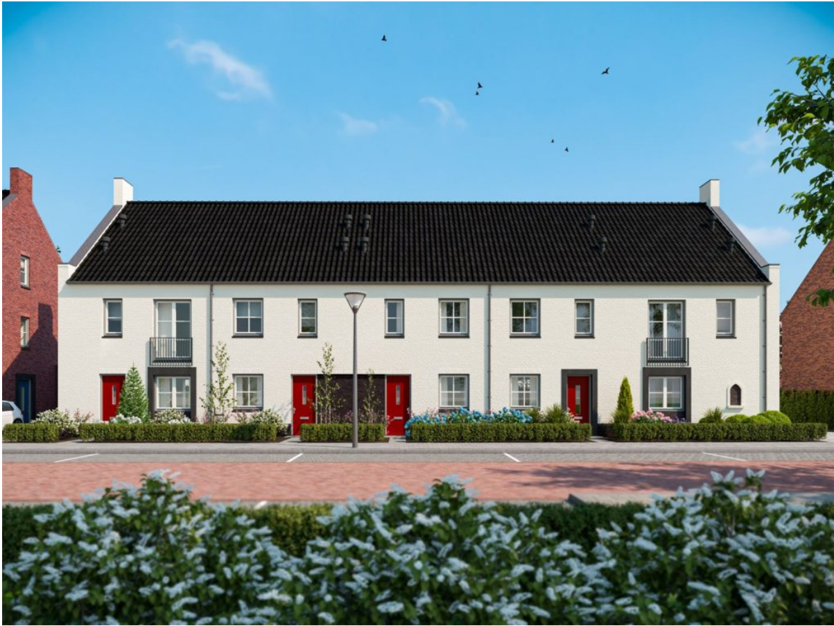
6 ruime eigentijdse hoekwoningen (type A2 + A3)